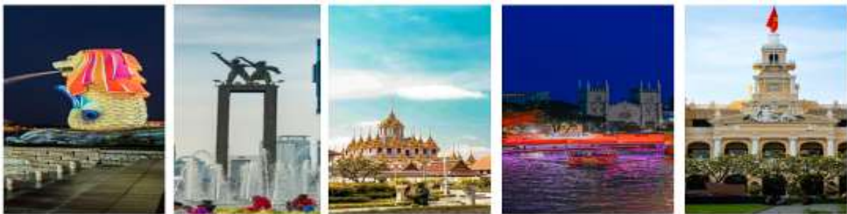
Package เรือสำราญ เดินทางด้วยตัวเอง (Cruise Only)