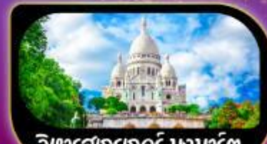
วิหารสกรทอร์ มงมาร์ต