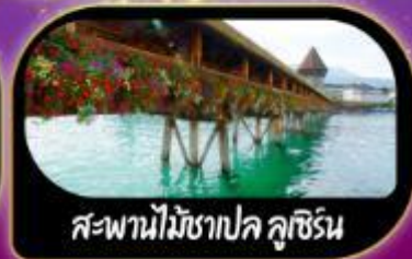
สะพานไม้ชาเปล ลูซิิร์น