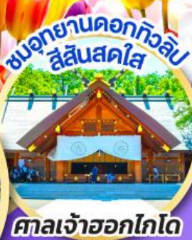
ศาลเจ้าออกโทโด