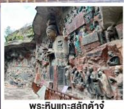
พระหินแกะสลักตัวจู้