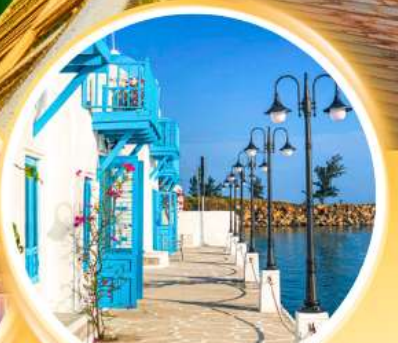
Son tra marina cafe