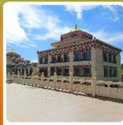
ทำเนียบพระลามะอูหลาน

• ไฮไลท์ เป็นทราseyเสียงชาวน แผล่งทองเที่ยวระดับ 5A ของจีน แกรนด์แคนยอนแม่น้ำเหลือง ซึ่อูฐท่ามกลางทะเลทราย