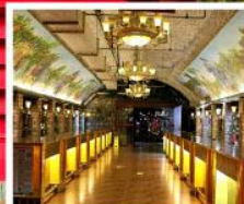
พิพิธภัณฑ์ไวน์ชิงเต่า