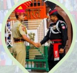
พิธีลดธงพระแดน อินเดีย-ปากีสถาน ชายแดนวากา (Wagah border)