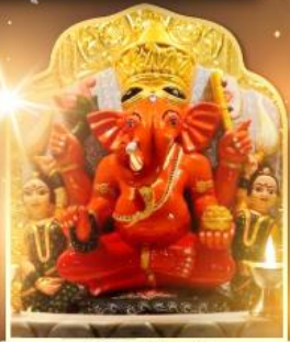
องค์สิทธีวินายก