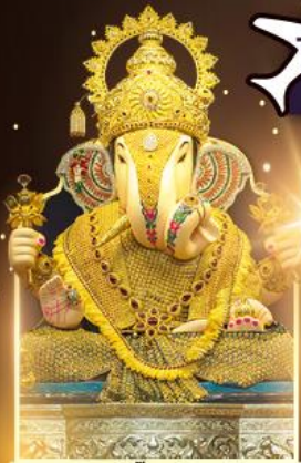
องค์ดีกษุท์เศษฐ์