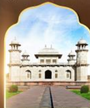
ทัชมาฮาลน้อย