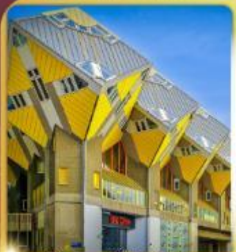
บ้านลูกเต่า โลก์คูมูส

“ล่องเรือหลังคากระจก” ชมกรุงอัมสเตอร์ดัม