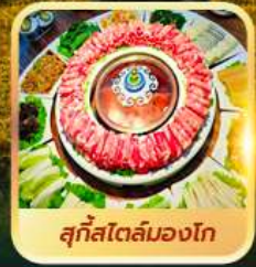
สุกีสโตลมองโก