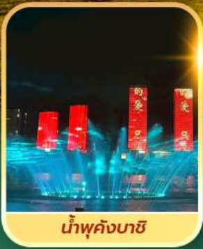
น้ำพุคังบาซี