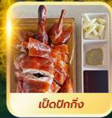
เบ็ดปักกิ้ง