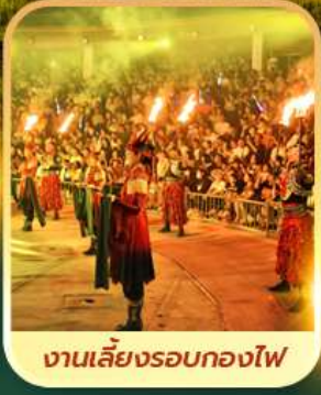
งานเลี้ยงรอบกองไฟ