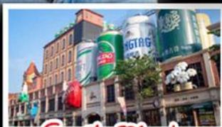
โรงแรมเป่ย์ชิ่งเต่า