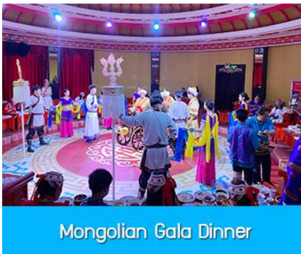
Mongolian Gala Dinner

那达慕 Naadam Festival หรือเทศกาลเฉลิมฉลองที่คล้ายวันตรุษจีนของชาวจีน ประกอบด้วยกิจกรรมการเล่นพื้นเมืองแบบมองโกล รวม 22 อย่าง ได้แก่ พิธีแต่งงานเออร์คอส / การขี่ม้าในสนาม / ปาร์ตี้รอบกองไฟ / ขี่ม้าถ่ายรูป / ไล่ไลเดอร์หญ้า / รถลางทุ่งหญ้า / สวนแขวงกต/สวนเด็กเล่น / ตีกอล์ฟทุ่งหญ้า / รถบังคับ / รถโกคาร์ต / โยนบอลทุ่งหญ้า / ปั่นไฟมองโก / ยิงธนูในร่ม / แข่งขันจับแกะ / คล้องม้าจำลอง / หมูเลี้ยงน้ำเอ็นดู / เครื่องเล่นหมุน / เลี้ยงแกะโยน / ยิงธนู / ทอยแจกัน / เซ็นต์ชื่อภาษา มองโก ให้เลือกเล่นได้ 12 อย่างตามรายการที่ระบุ.....อัตราค่าบริการสำหรับ 那达慕 Naadam Festival 380 หยวน หรือ 1,900 บาท/ท่าน (สำหรับลูกค้าทัวร์ที่ไม่ซื้อโปรแกรมเสริม สามารถเดินเล่น ถ่ายรูปบริเวณทุ่งหญ้าหรือพักผ่อนตามอัธยาศัย)