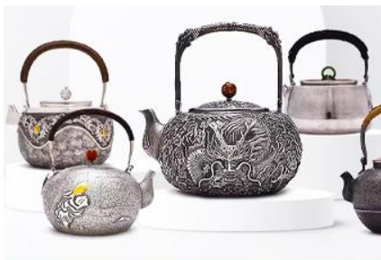
พิพิธภัณฑที่เครื่องปั้นบอโกล