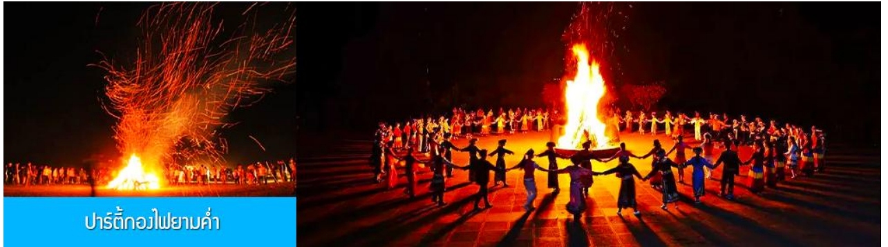
ปาร์ตี้กองไฟยามค่ำ