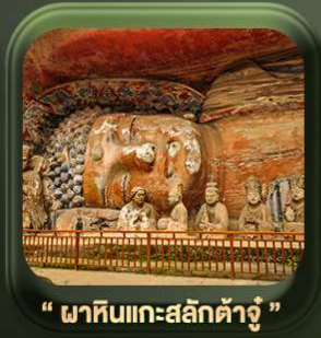
“ พาหินแกะสลักต้าจู้ ”