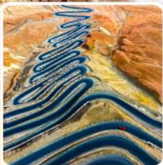
ถนนผานหลงกู่ต้าว