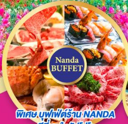
พิเศษ บัฟเฟต์ร้าน NANDA ดั้งเดิมในชิบโปโร