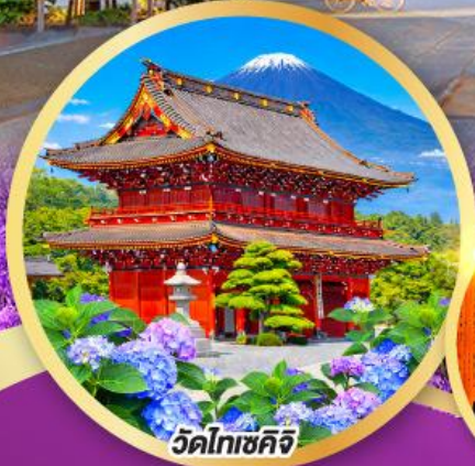
วัดโทเซคิจิ