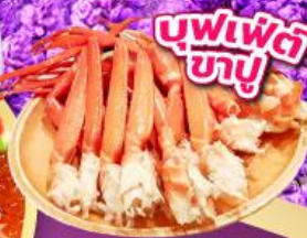
บุฟเฟ่ต์ ซาซุ