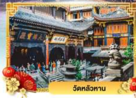
วัดหลัวหลาน