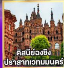
คิสนีย่งฉิ่ง ปราสาทเวกมมตร