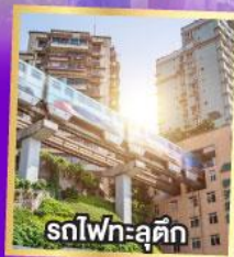
รถไฟฟ้า-ลู่ตัก

เที่ยวเต็มอิ่ม..ไม่ลงร้านช้อปปิ้ง นั่งรถไฟความเร็วสูง 2 เที่ยว ไม่มีออฟชั่นเพิ่ม