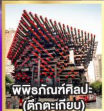
พิพิธภัณฑ์ศิลปะ- (ตึกตะเกียบ)