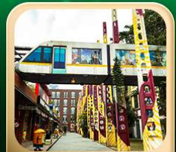
“ตงเจียวจื่อ”