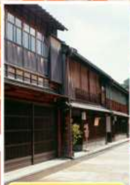
ย่านอิงาชิซายะ