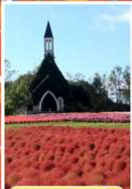
สวนดอกกะโนะซาโตะ