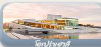
โตปราคาเซีย

เดินทาง 11-19 มิ.ย. 69 / 23-31 ก.ค. 69 / 05-13 ส.ค. 69 / 03-11 ก.ย. 69 / 24 ก.ย.-02 ต.ค.69