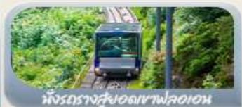
ฟังกรางสูงอดเขาฟลอมอน

สักครั้งในชีวิตกับการนั่งรถไฟสายโรแมติกฟลิมสบาน่า สองเรือชมฟยอร์ด ขึ้นกระเช้าลอยฟ้าพิชิตยอดเขาอูลริเคน เบอร์เกน นั่งรถรางสู้ออดเขาฟลอมอนชมวิวเมือง ออสโล เยี่ยมชมโอปราคาเซีย มหาวิหารออสโล ป้อมปราการอาครสูส สวนอนุชชาติ Vigeland Sculpture Park