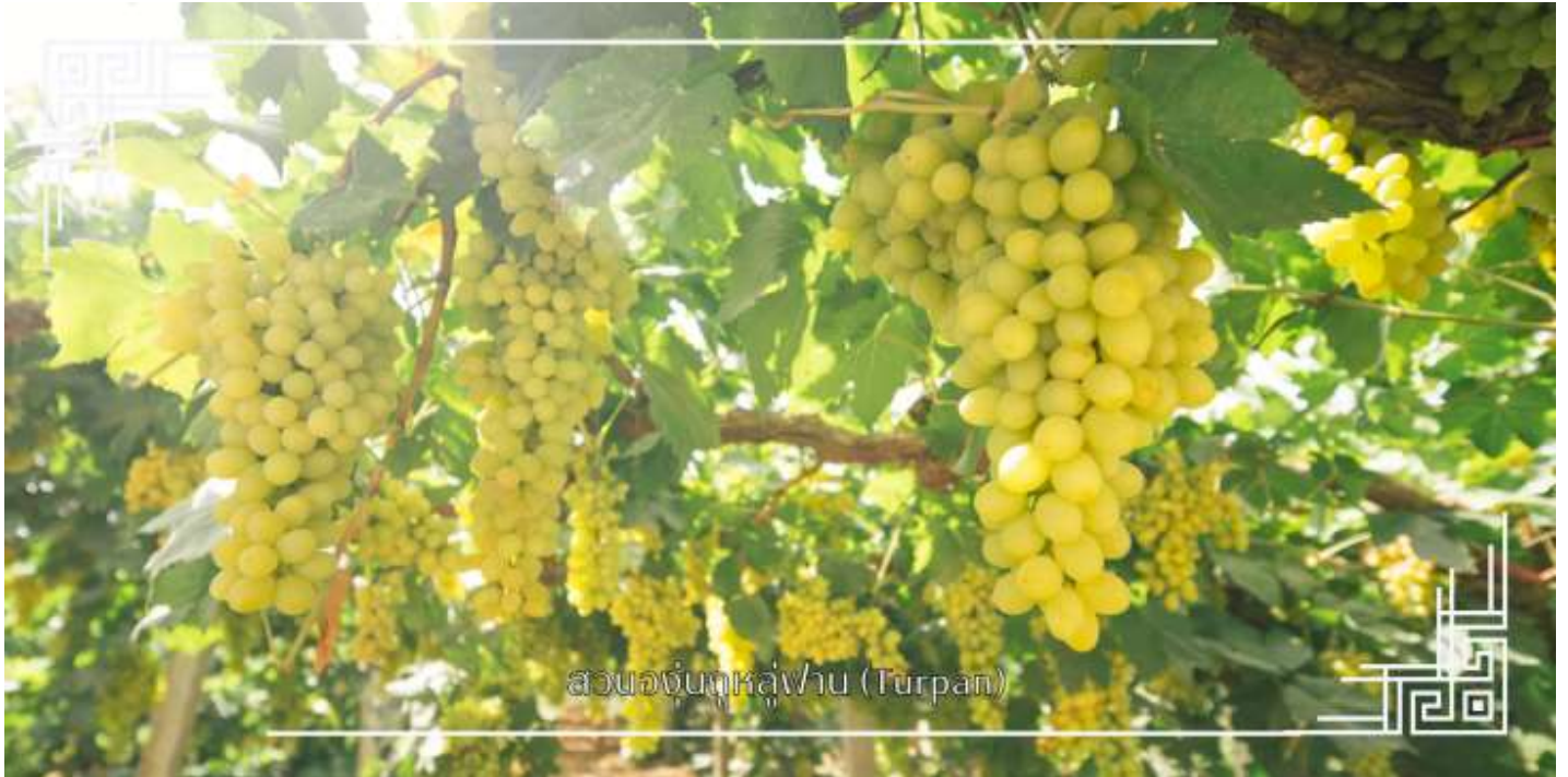
สวนองุ่นทะเลสาบ (Turpan)

นำท่านแวะชม สวนองุ่น (มีเฉพาะเดือนมิถุนายน-สิงหาคม) แหล่งผลิตองุ่นไร้เมล็ดที่หวานและใหญ่ที่สุดของจีน ในหุบเขาที่ ร่มรื่นไปด้วยเถาองุ่นสีเขียวขจี ท่ามกลางบรรยากาศร่มรื่นกลางทะเลทราย