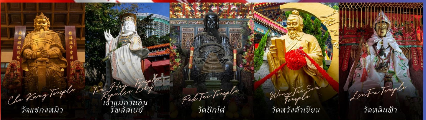
Che Kung Temple วัดแซกงหมิว

รายการทัวร์ข้างต้นอาจมีการปรับเปลี่ยนเพื่อความเหมาะสม