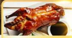
เปิด Four Season