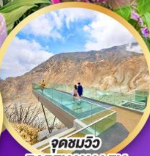
จุดชมวิว EARTH VALLEY