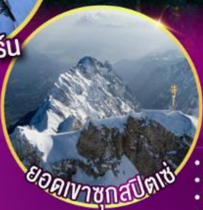
ยอดเขาชุกสปีตเซ