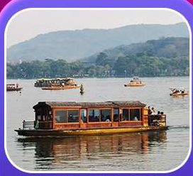
“ล่องเรือทะเลสาบซีหู”