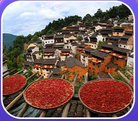
“หมู่บ้านหวงหลิง”

หุบเขาเทวดาวังเซียนกู่ หมู่บ้านที่ตั้งอยู่ริมหน้าผา • หมู่บ้านโบราณหวงหลิง ป่าสนน้ำชิงซาน • ล่องเรือทะเลสาบซีหู • ถนนโบราณตุ๋นโจ้ว • ชมแสงสีที่ ฉู่หนีโจ้ว