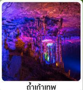
ถ้ำเก้าทพ