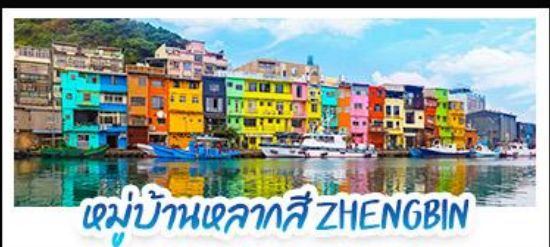
หมู่บ้านหลากสี ZHENG BIN

18 - 21 ก.ค. 69 | 12 - 15 ก.ย. 69 15 - 18 ส.ค. 69 | 28 - 31 ต.ค. 69