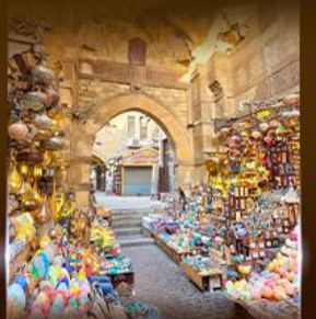
ตลาดงานเทศกาล