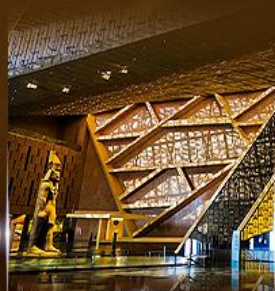
พิพิธภัณฑ์ไทรนด์อียิปต์ (GEM)