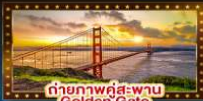
ถ่ายภาพคู่สะพาน Golden Gate