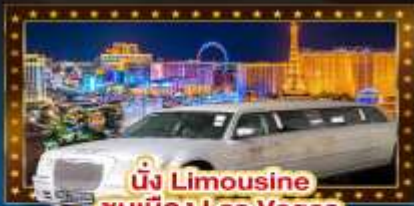
นั่ง Limousine ชมเมือง Las Vegas