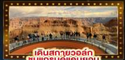
เดินสกายวอล์ก ชมแกรนด์แคนยอน