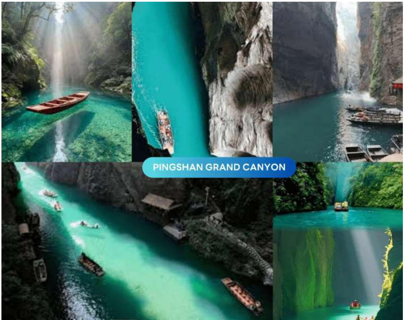
PINGSHAN GRAND CANYON

นำท่านออกเดินทางสู่ หุบเขาผิงซาน (Pingshan Canyon) สัมผัสประสบการณ์การล่องเรือเข้า-ออก เพื่อเพลิดเพลินกับธรรมชาติภายในหุบเขาและบนผืนน้ำที่ได้รับการขนานนามว่า "ใสที่สุดในประเทศจีน" ด้วยความใสสะอาด ทำให้ท่านสามารถมองเห็นเงาสท้อนของเทือกเขาและท้องฟ้าบนผืนน้ำได้อย่างแจ่มชัด จนดูราวกับว่าเรือกำลังลอยละล่องอยู่กลางอากาศ (ราคาล่องเรือรวมในราคาทัวร์)