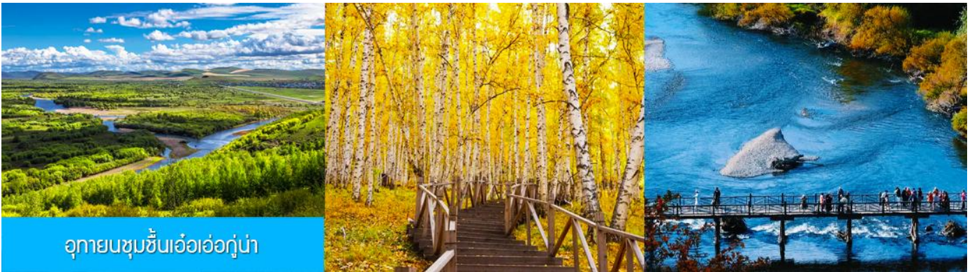
อุทยานชุ่มชื้นเอ้อเอ่อกู่หน่า

รับประทานอาหารเช้า ณ ห้องอาหารของโรงแรม (16)