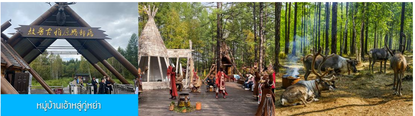
หมู่บ้านเอ้อเอ่อกู่หน่า