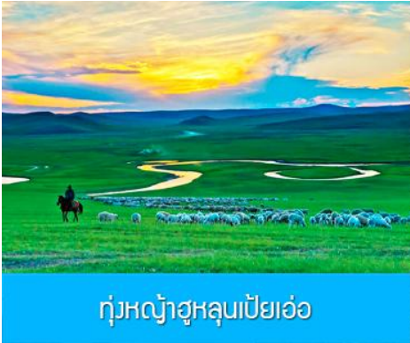
ทุ่งหญ้าฮูลุนเปียวเอ๋อ