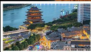
ถนนคนเดินสามตรอกสองซอ