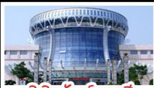
พิพิธภัณฑ์ทักวางสี

สวนสนุก FANTASYLAND - หมู่บ้านสไตล์ยุโรป พิพิธภัณฑทักวางสี - ถนนคนเดินสามตรอกสองซอ ท่าเรือถึงจ้อ - ศาลเจ้าแม่กวมูอิมพันกร เมนูพิเศษ อาหารกววงตุง , สุกีซาบูหมาล่า