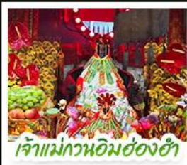
เจ้าแม่กวอนอิมฮ่องฮ่า