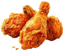
● เนื้อสัตว์ปีก (ไก่)