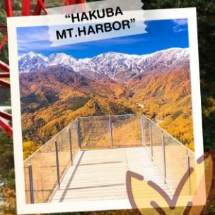
"HAKUBA MT. HARBOR"

วันเดินทาง 28 ต.ค. - 3 พ.ย. 2569 4 - 10 , 11 - 17 พ.ย. 2569