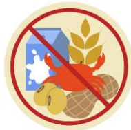
● แพ้อาหาร / อื่นๆโปรดระบุ