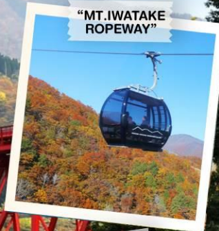
"MT. IWATAKE ROPEWAY"