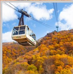
“ZAO CHUO ROPEWAY”