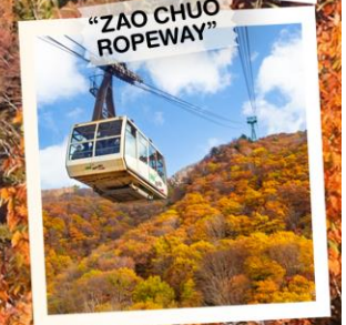
"ZAO CHUO ROPEWAY"

วันเดินทาง 30 ต.ค. - 5 พ.ย. 2569 4 - 10 พ.ย. 2569