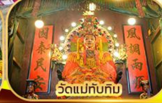
วัดแม่ทับทิม