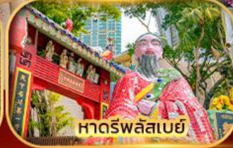
หาดรพลัสเบย์