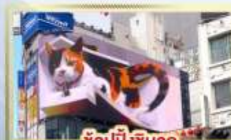
ซูปป์ิงชินจูกุ