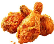
● เนื้อสัตว์ปีก (ไก่)