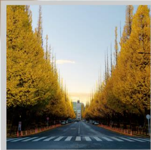
“ICHONAMIKI GINGO AVENUE”