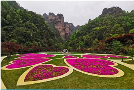
อุทยานฟงเลียนซี