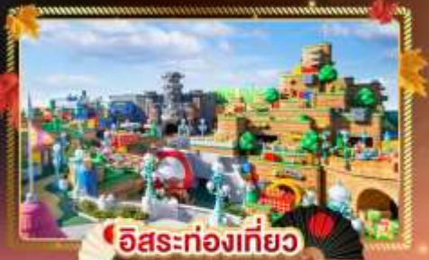
อิสระท่องเที่ยว