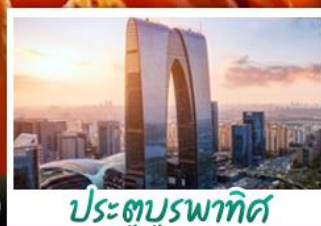
ประตูบูรพาทิศ