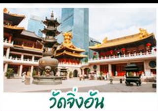
วัดจิ้งอัน