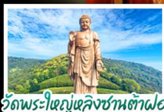
วัดพระใหญ่เฉิงชานต้าฝอ