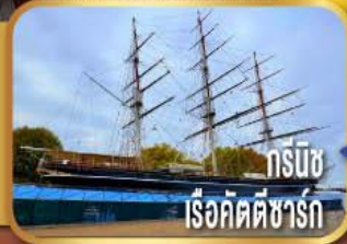
กรีนวิช เรือคัตตีซาร์ก