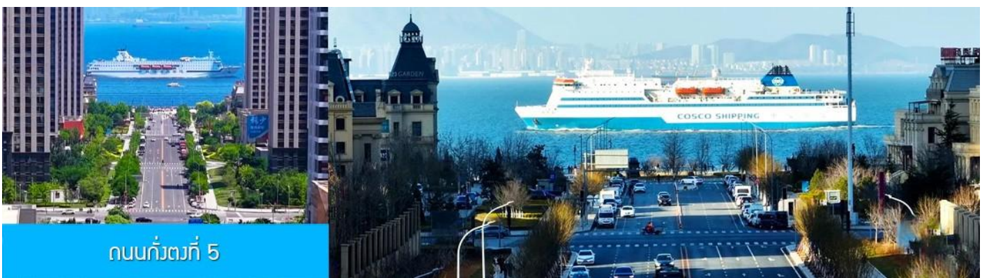
ถนนกว้างที่ 5

จากนั้นนำท่านเที่ยวชม สวนน้ำเมืองเวนิสตะวันออก 大连东方威尼斯城 เป็นเมืองเวนิสจำลองที่ถูกสร้างขึ้นด้วยทุนกว่า 8,000 ล้านดอลลาร์ ออกแบบโดยบริษัท ARC จากประเทศฝรั่งเศส โดยจำลองผังเมืองเวนิสในประเทศอิตาลี บนพื้นที่กว่า 400,000 ตารางเมตร ประกอบด้วยคลองเวนิสและอาคารที่มีสถาปัตยกรรมแบบตะวันตกกว่า 200 หลัง มีบริการล่องเรือคอนโดล่าแก่นักท่องเที่ยว นำท่านเดินชม ถ่ายภาพที่ระลึกท่ามกลาง