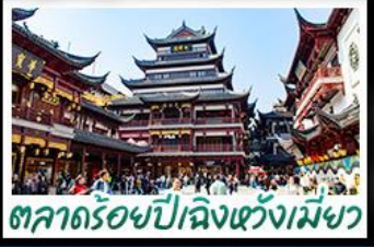
ตลาดร้อยปีเฉิงหวังเมี่ย