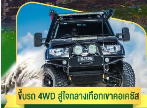
คันรถ 4WD สู้อใจกลางเทือกเขาคอเคซัส