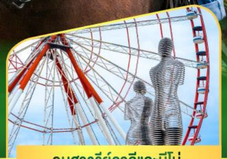
อนุสาวรีย์อาลีและนีโน่