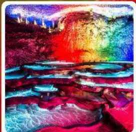
ถ้ำเก้าเทพ