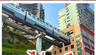
รถไฟทะลุคัง